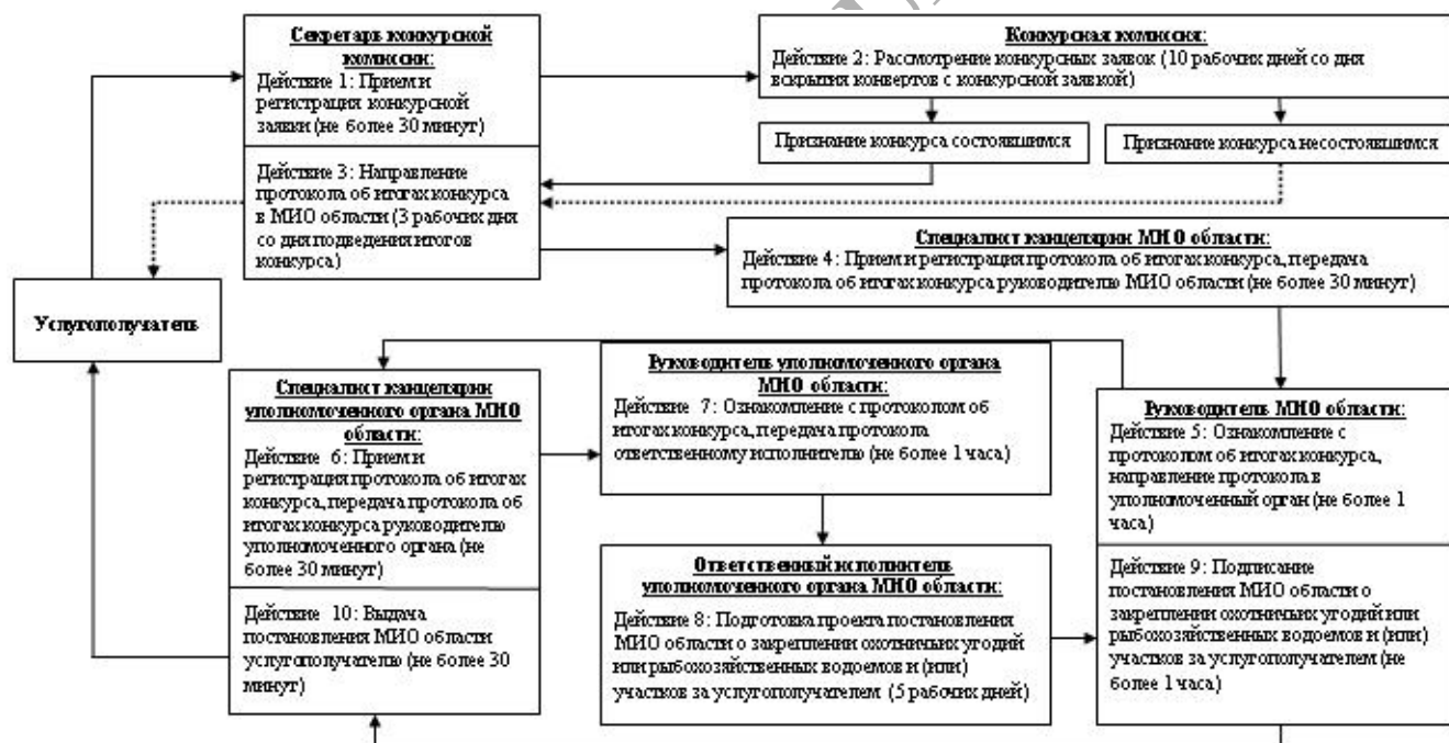
Схема 2, отражающая взаимосвязь между логической последовательностью взаимодействий СФЕ - при закреплении охотничьих угодий на земельных участках, находящихся в частной собственности или во временном землепользовании услугополучателей, а также при перезакреплении охотничьих угодий, срок закрепления по которым истек.