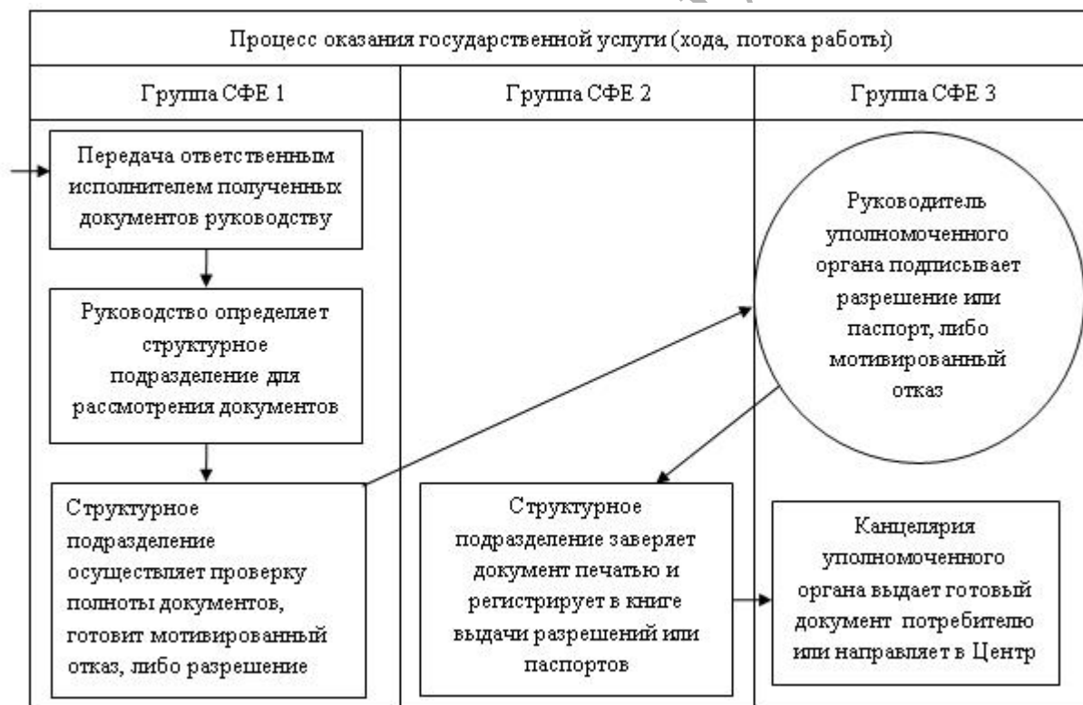
Схема, отражающая взаимосвязь между логической последовательностью административных действий