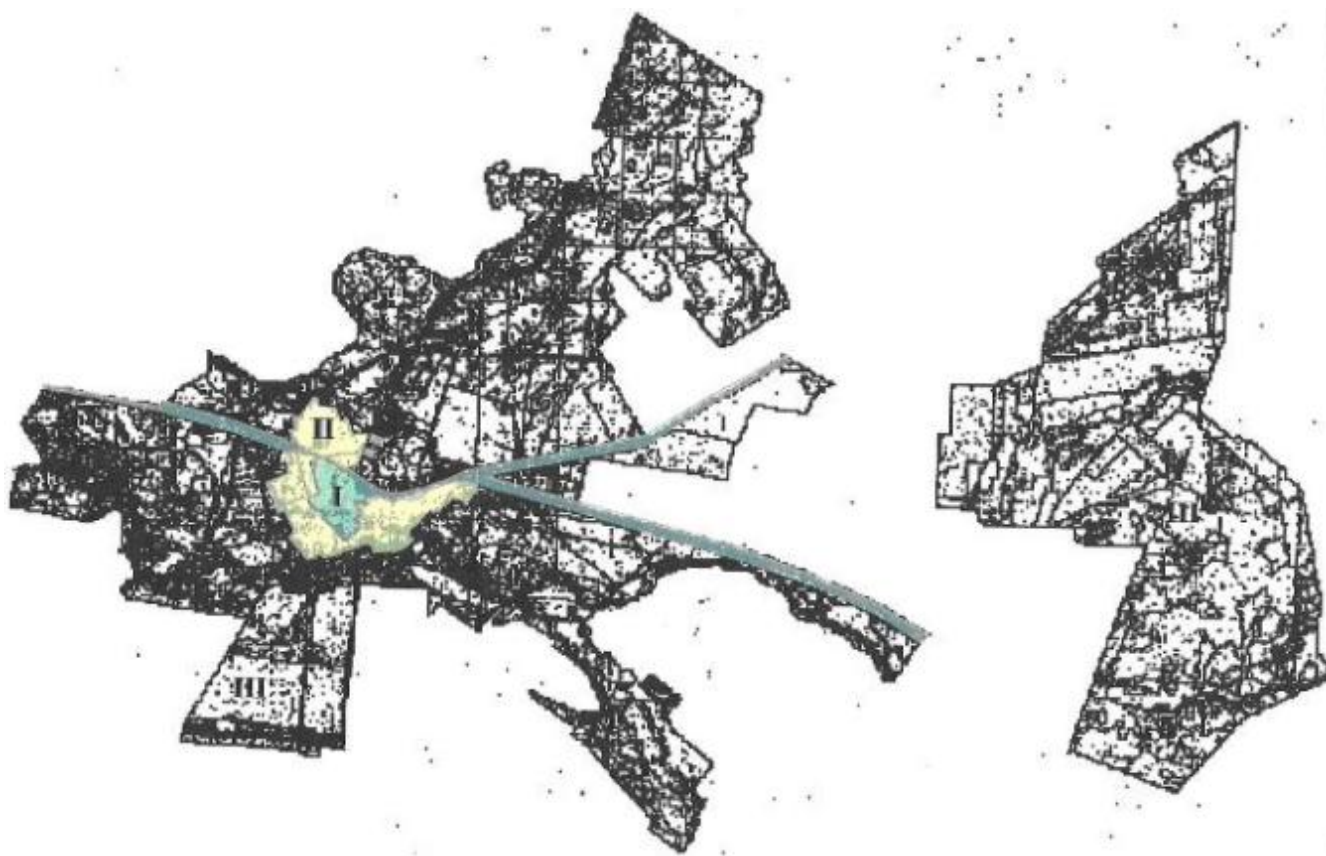
Схема зонирования территории поселка Ботакара для определения кадастровой (оценочной) стоимости и для целей налогообложения