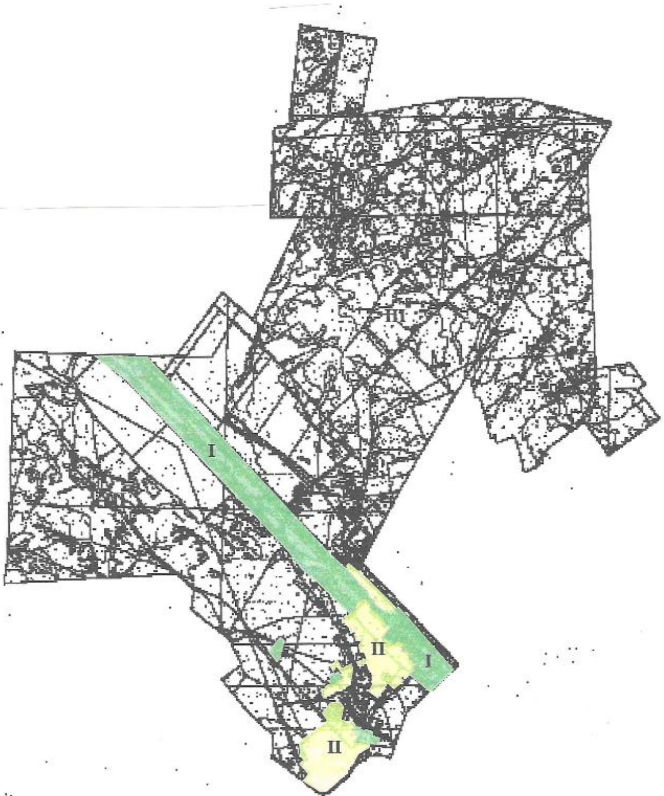
Приложение 3 к решению 34 сессии Бухар-Жырауского районного Маслихата