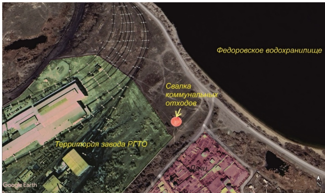
Рис. 1.2 – Несанкционированная свалка в районе Федоровского водохранилища 49°44'51,9"С 73°04'07,8"В возраст свалки более 4-х лет.